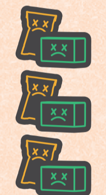
一年所產生的 網購包裝垃圾