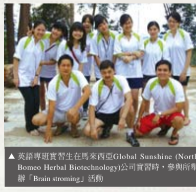
▲英語專班實習生在馬來西亞Global Sunshine (North Borneo Herbal Biotechnology)公司實習時，參與所舉辦「Brain storming」活動

管理學院資源眾多，同學可透過主修領域的學程、跨院學程、產業學程的選擇，朝向多元化的發展；亦提供與實務連結的企業實習課程，包含暑假企業實習、海外企業實習、海外研修等多元管道；擁有可與來自各國學生交流的國際化學習環境，讓學生能體驗跨文化的差異性，培養國際觀，且與國際友校的實質交流合作，如短期進修、雙聯學位、國際認證課程、交換學生與海外交流拜訪，更是拓展國際視野的最佳機會；完整的各領域實驗室訓練學生成為優秀專業人才。管院今年暑假即有多位學生前往馬來西亞吉隆坡及檳城參加企業實習，充分體驗了不同文化的企業運作狀況，培養學生的「態度」，也訓練他們的看事情的「高度」，開拓國際視野，對於未來就業有十足的助益。