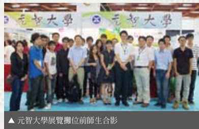
▲元智大學展覽攤位前師生合影

第6屆「台北國際發明暨技術交易展」(2010 Taipei International Invention show and Technomart)於9月30日至10月3日於台北世貿一館舉辦，此活動視為智慧財產與技術媒合的最佳平台，元智大學近年來係以學術為基礎，致力於應用研究，配合活動選定之「智慧生活」、「綠色節能」及「生醫保健」3大主題，以「智慧感測」、「智慧控制」、「智慧醫療」及「智慧能源」四大主軸共13項技術參加發明競賽，今年大會共展示962項新奇專利技術及創新發明作品參加競賽，參展國家與廠商包括台灣、美國、馬來西亞、俄羅斯、波蘭以及韓國等18個國家發明協會、發明人及相關產業廠商，元智大學研究團隊表現亮眼，共獲得3面金牌、3面銀牌及2面銅牌之佳績。