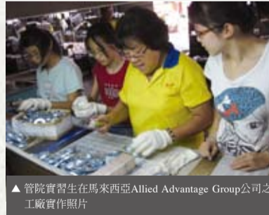
▲管院實習生在馬來西亞Allied Advantage Group公司之工廠實習照片