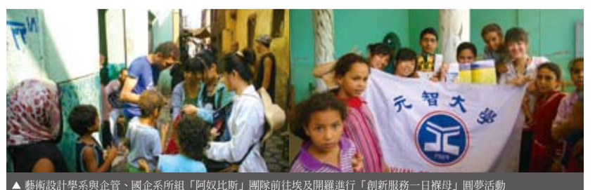
▲藝術設計學系與企管、國企系所組「阿奴比斯」團隊前往埃及開羅進行「創新服務一日報母」圓夢活動