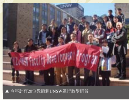
▲今年計有20位教師到UNSW進行教學研習

元智大學為打造優質雙語學習環境，2009年創校廿周年慶，校方畫出「Vision 20」的發展藍圖，矢志讓元智邁向台灣第一所「雙語大學」，半數專業課程四年內全英語教學。校方不但要求學生的英文程度，暑期還特別為新生舉辦英語營夏令營。這(99-1)學期開始，為求英語教學的精準，同步要求校內老師進修，透過與全球排名第45，全球21所優秀的研究型大學Universitas 21的成員之一的澳洲新南威爾斯大學(UNSW)簽訂合作備忘錄，自今年暑假起連續五年，每年送教師進修研習英語教學的技巧，讓元智英語教學更上層樓。