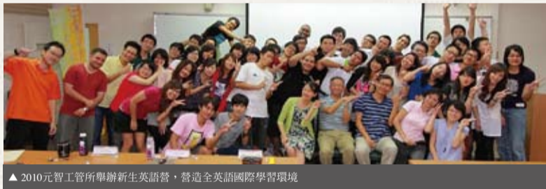
▲2010元智工管所舉辦新生英語營，營造全英語國際學習環境