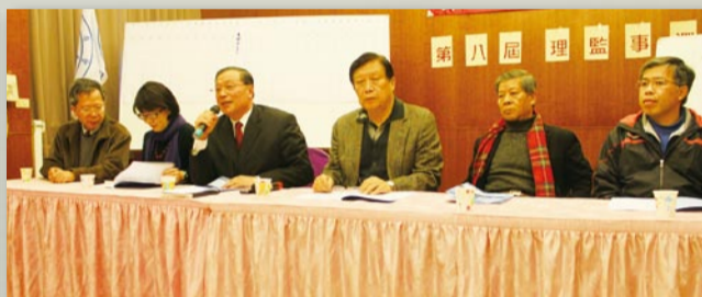
▲ 元智大學校友會第八屆第一次會員大會及理監事改選於3月2日午後舉行