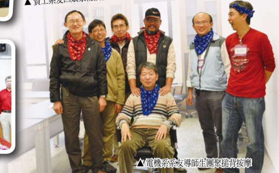
▲電機系系友導師生團聚踏青教學