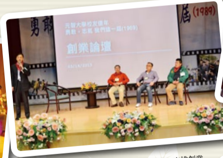
▲ 開創的基因在元智第一屆校友身上竄流，安排創業經驗分享