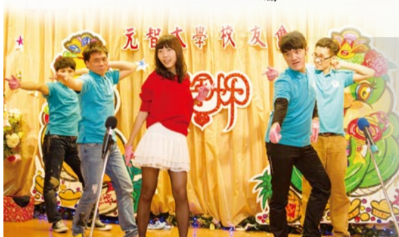
▲ 2013年3月2日晚上舉行「2013新春如意 蛇躍好前程」校友春酒餐敘聯誼