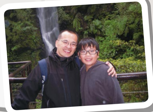
元智大學校友會第八屆秘書長

2004年管理學院EMBA畢業 現職： 立法委員陳根德特別助理 協山通運股份有限公司總經理