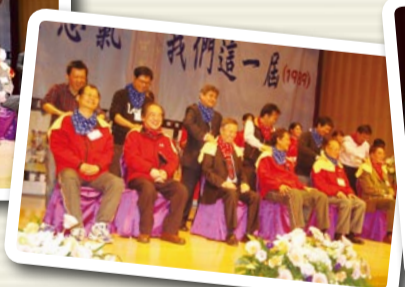
▲ 校友代表行按摩捶背報師恩儀式