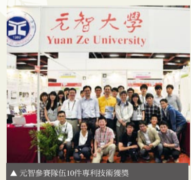
▲元智參賽隊伍10件專利技術獲獎

元智大學由研發處整合全校專利技術成果參加發明競賽，邀請化材、通訊、機械及電機系所教授共12件技術參賽，獲獎10件（3金、3銀、4銅），為本次競賽活動獲獎數最高的參賽單位。