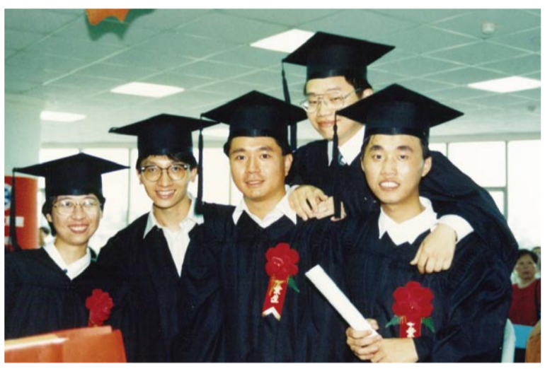
▲左二即為本文作者，攝於1993年畢業典禮

Dear Principle, Professors and Classmates,