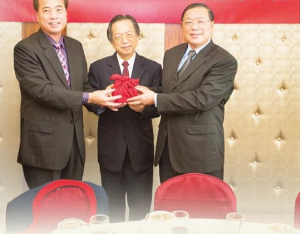
▲ 第七、八屆校友會會長交接