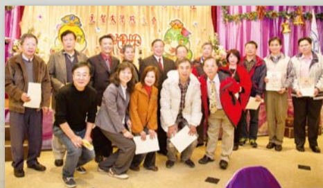
▲ 校友會全體理監事感謝校友熱情參與校友活動