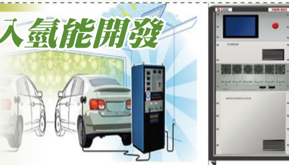
▲圖：理想化的未來家庭氫氣供給系統與燃料電池車（左）；光騰光電開發之氫氣供給系統（右）

透過元智大學與光騰光電所研發的「加氫站用質子交換膜產氫技術」，除了將可與世界同步帶領汽車產業逐步邁入環保、低碳的氫能經濟外，更可結合再生能源，自給自足產氫發電，進入能源安全的新世紀。