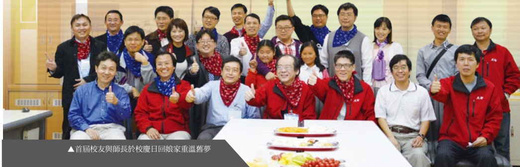
▲首屆校友與師長於校慶日回娘家重溫舊夢

2013年機械系首屆校友回娘家於3月校慶日安排師生座談活動,並將於6月8日(星期六)上午11:30於三館舉行系友大會,誠摯邀請您再度回到美麗的元智校園,歡迎攜伴參加,與老師們敘舊,一同分享與老友久別重逢的喜悅!