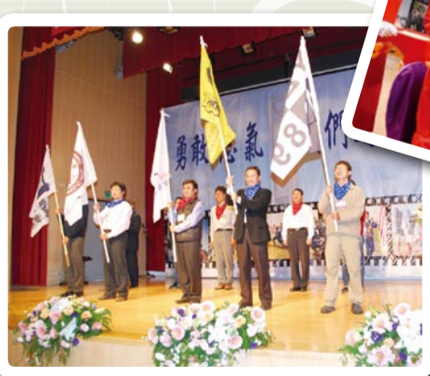
▲ 永續·傳承 我們第二屆報到