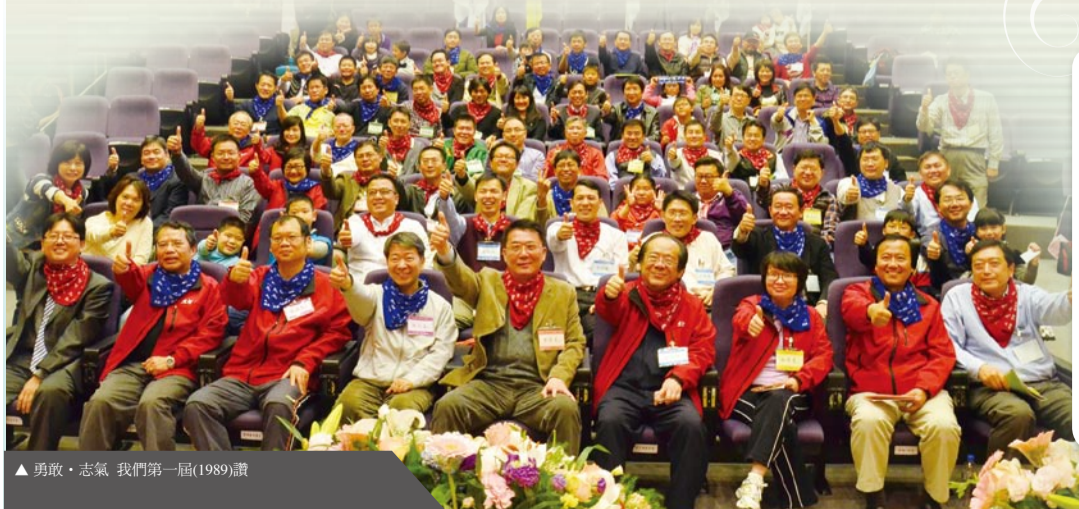
▲ 勇敢·志氣 我們第一屆(1989)讚