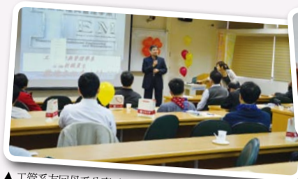
▲工管系友回母校分享系務各項發展與校友經驗分享

公共事務室特別依照校友值年幹部期許,找回往日北大荒元智味一大鍋炒米粉、豬血湯的學生料理,在各項感恩謝師禮、關懷學弟妹等主題性慶典活動前滿足師生五臟廟,會後各系亦熱請邀約舉辦系友回娘家聯誼座談活動,帶給首屆校友滿滿回憶與重溫青春的一天。