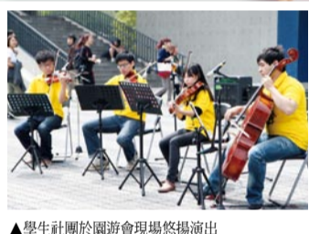
▲學生社團於園遊會現場悠揚演出