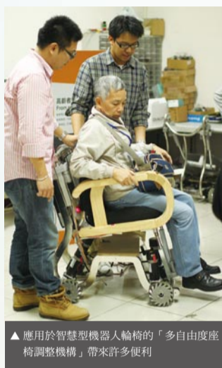
▲應用於智慧型機器人輪椅的「多自由度座椅調整機構」帶來許多便利