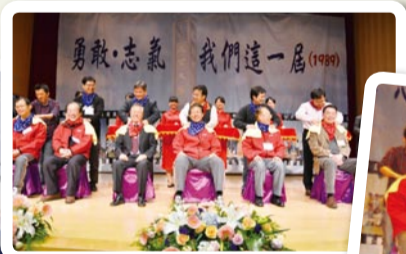
▲ 老師，您辛苦了，學生為您捶背