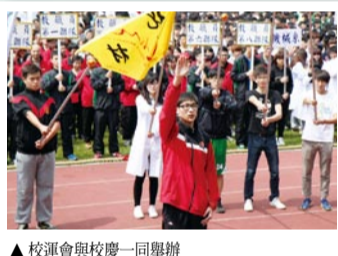
▲校運會與校慶一同舉辦