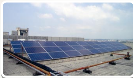
▲節能一七館太陽能光電發電—光電板

元智大學創校邁入24年，在教學、研究、行政及校園環境等四方面，屢獲各類評鑑肯定，並受各界高度認同。近年來，元智在執行校園電力監控及節能管理計畫已有明顯成效，屢獲外界肯定，獲選為全國十三所「綠色大學」之一及全國唯一「溫室氣體減量示範大專院校」；在教育部「98年及100年大專院校校園環境管理現況調查暨績效評鑑」大專院校中，係唯一連續獲得「特優等」殊榮；2010年更獲行政院環保署推薦為「99年推動環境保護有功學校」全國三所大專院校之一；2011年獲得經濟部節約能源績優獎表揚活動選拔機關學校組唯一「傑出獎」殊榮，更於2011年11月成為全球第一所通過能源管理系統ISO 50001國際認證大專院校；並根據2012世界綠能大學榜，元智大學名列全國大專院校前3名佳績。