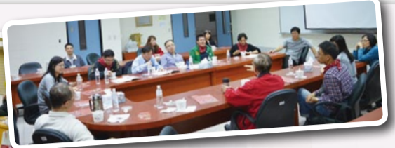
▲資工系友回娘家暢談當年專業實習