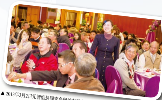
▲ 2013年3月2日元智師長同來參與校友年度大型聚會活動