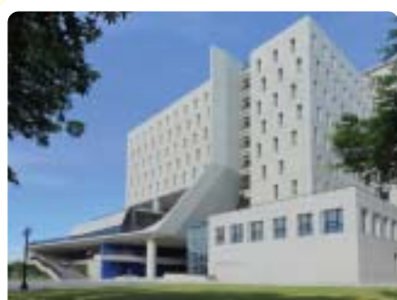
▲遠東有庠通訊大樓(七館)獲2008台灣建築獎首獎