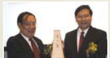
▲ 陳之藩獲頒第一屆元智大學桂冠文學家獎