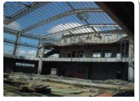
▲1994年施工中之體育館