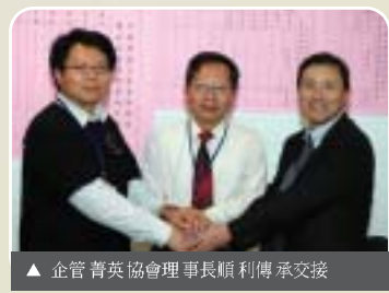
▲ 企管菁英協會理事長順利傳承交接

元智20週年校慶當日(3/14)，中華民國企管菁英協會召開第五屆第一次會員大會及理監事會議。會中除了順利通過各議案，這次會議也進行了理事長、常務監事及理監事改選。