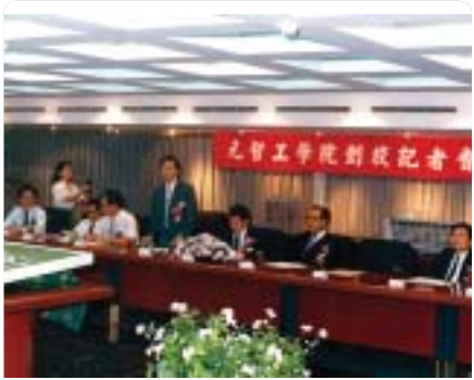
▲1989年元智創校記者會