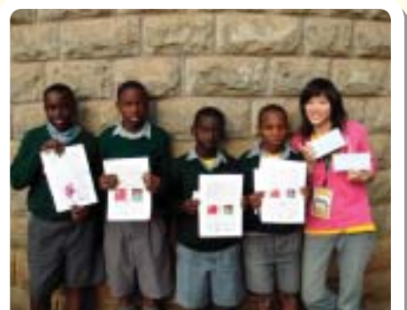
▲2007學生赴肯亞進行國際志工服務