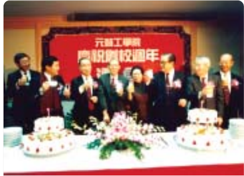
▲1992年創校一週年慶祝大會