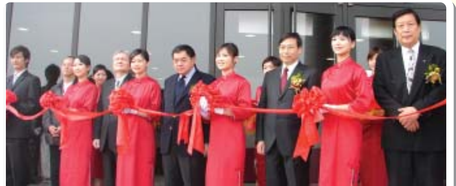
▲2007年健康休閒中心啓用儀式