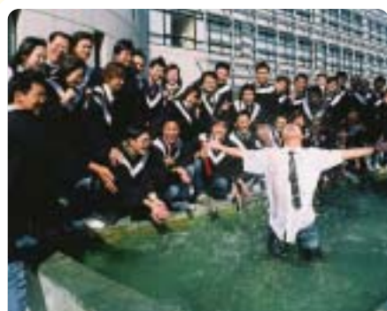
▲2007年學生畢業前合影