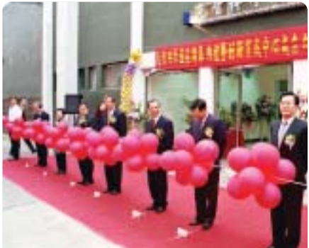
▲2003年元智科學園區開幕剪綵