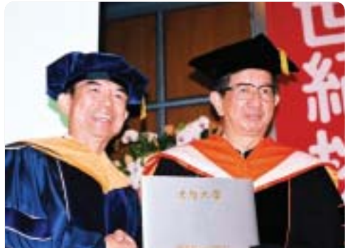
▲2003年元智大學首屆名譽工學博士授予李遠哲