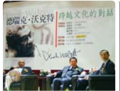
▲2005年諾貝爾文學獎得主德瑞克·沃克特蒞校演講