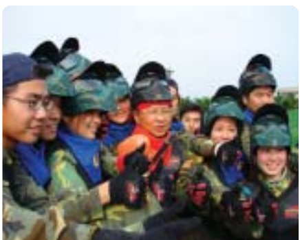
▲2005年全國首創全民國防創意課程—漆彈