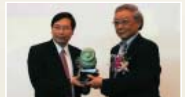
▲ 鄭愁予獲頒第三屆元智大學桂冠文學家獎