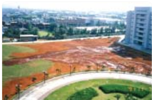
▲1991年圖書資訊大樓(五館)預定地