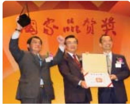
▲2003年元智獲行政院國家品質獎