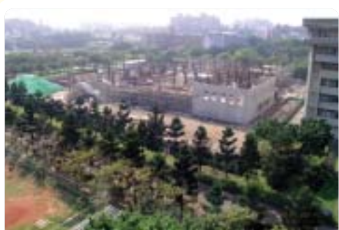
▲2007年遠東有庠通訊大樓(七館)施工