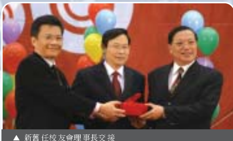
▲ 新舊任校友會理事長交接