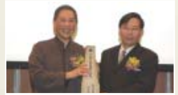
▲ 白先勇獲頒第二屆元智大學桂冠文學家獎