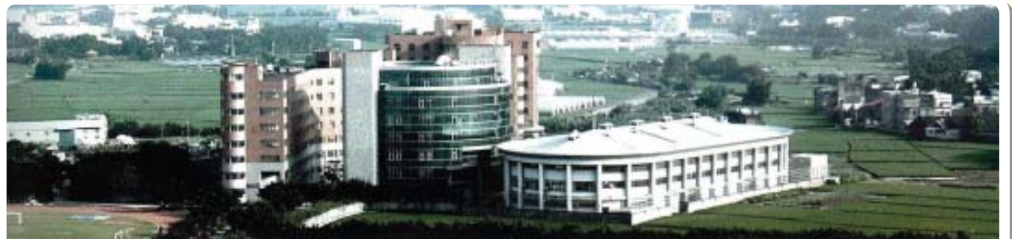
▲學生活動中心、宿舍及體育館