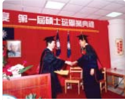
▲1992年第一屆碩士畢業典禮