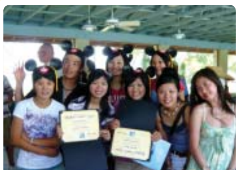
▲2007年學生赴美國迪士尼樂園專業實習