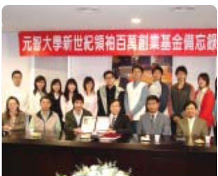
▲2006年頒發新世紀領袖百萬創業基金儲忘錄