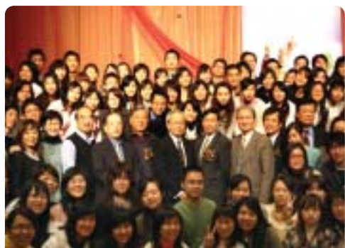
▲2006年正式啓動「Ye Si r師友計畫」