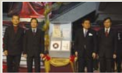
▲ 元智大學創校以來三位校長與董事長共同呈獻校史至校史館