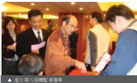
▲ 進行第六屆理監事選舉