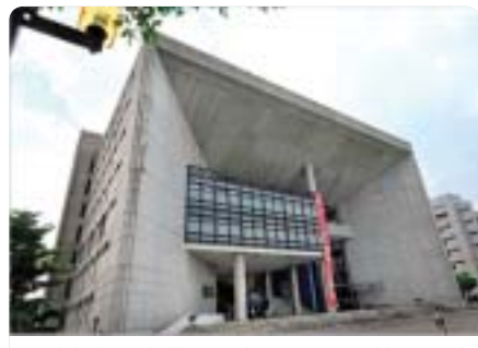
▲圖書資訊大樓(五館)獲1999年第一屆遠東傑出建築設計獎