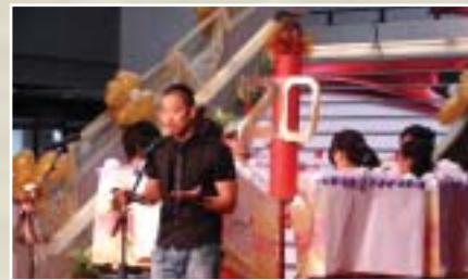
▲ 外籍生祝福元智生日快樂