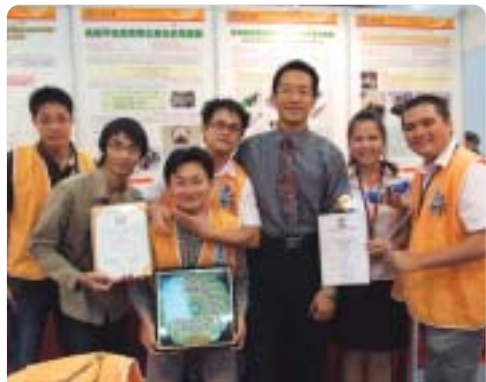
▲2008年元智於台北國際發明暨技術交易展獲七面金牌