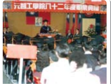
▲1994年第一屆畢業生的畢業典禮