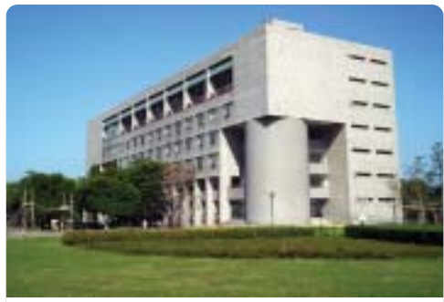
▲目前一館前方已樹林聳立