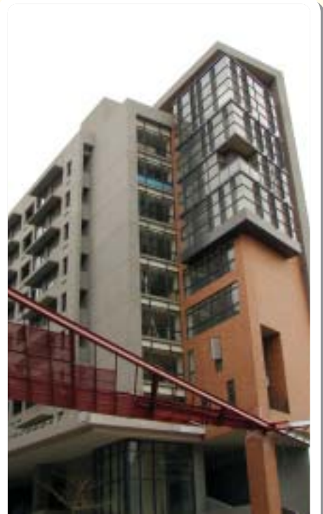
▲2009年元智第三宿舍完工