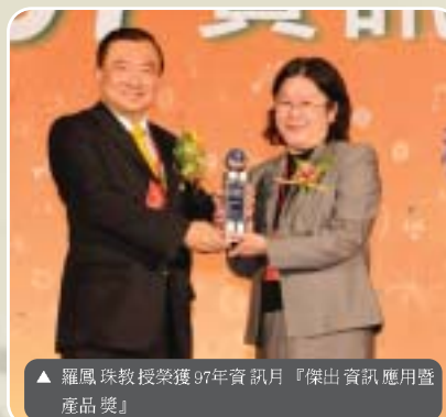
▲ 羅鳳珠教授榮獲97年資訊月『傑出資訊應用暨產品獎』