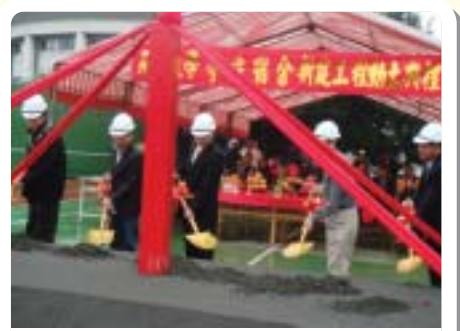
▲2007年第三宿舍動土儀式