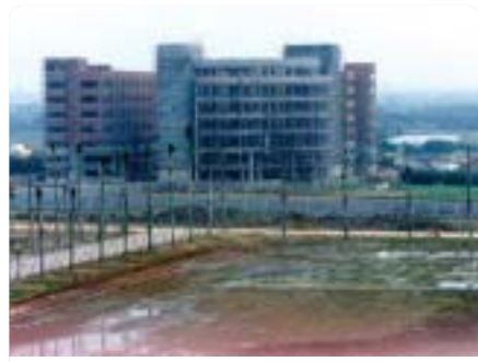
▲1991年興建中之活動中心