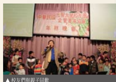
▲校友們與親子同歡