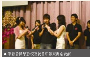
▲畢聯會同學於校友餐會中帶來舞蹈表演