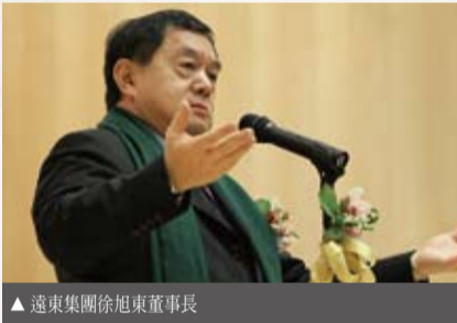
▲ 遠東集團徐旭東董事長

元智大學創校21週年校慶於2010年3月13日登場，以「健康·永續·樂活校園」為主軸的校慶系列活動，包括「水墨的抒情世界—李奇茂水墨特展」開幕、「樂World」世界迷宮、「樂樂欲試」手作市集、「健康·樂活校園」教職員健康促進活動等，典禮中並邀請遠東集團董事長徐旭東、桃園縣縣長吳志揚等貴賓參加。今年亦承襲元智校慶音樂會的傳統，邀請留學維也納的台灣藝術大學駐校藝術家吳聿奮先生等三位組成之「弦外之音三重奏」，共同慶祝元智生日快樂。