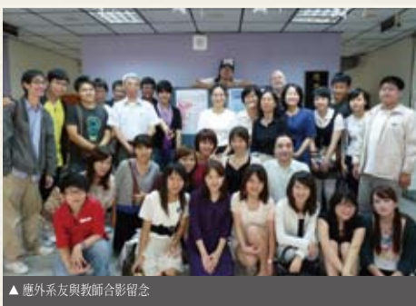
▲應外系友與教師合影留念