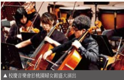
▲ 校慶音樂會於桃園婦女館盛大演出