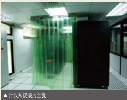
▲ 行政系統機房全貌

為配合整體綠色校園的政策，元智資訊圖書服務處(簡稱資服處)從2009年起開始著手進行一系列「綠色機房」工程，首先針對機房內最耗能的空調系統進行改善，建置機房內部冷熱空氣分離通道，以避免資訊設備散熱之熱空氣與空調系統之冷空氣混雜，造成能源之浪費。