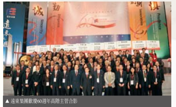
▲ 遠東集團歡慶60週年高階主管合影

為回饋滋養遠東集團生根茁壯一甲子的台灣社會，徐旭東董事長除了對同仁們的辛苦付出，致上最大感激外，並將安排向伴隨集團走過60年的社會夥伴們衷心致謝。未來遠東集團仍秉持「取之於社會、用之於社會」的一貫宗旨，持續投入公益活動，先台灣，而後擴及兩岸，希望明年再邀請大家齊聚一堂「攜手串連 共創美好未來」。