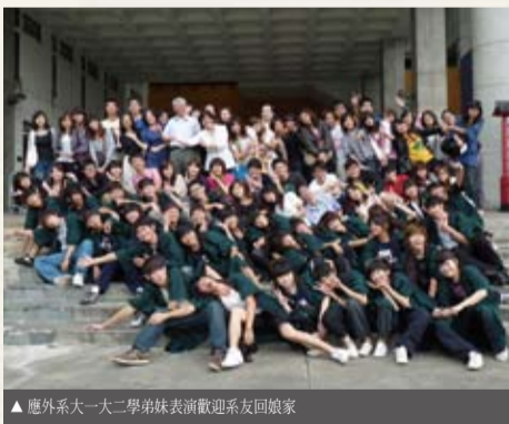
▲應外系大一、大二學弟妹表演歡迎系友回娘家

系友會活動串起了元智應外系系友與在學學弟妹的情誼，也再次連結了系友與老師們的連絡橋樑，活動在依依不捨的情愫下進入尾聲，也在應外系系友會記錄中留下美麗的一頁，期待未來能有更多系友返校參與活動，並藉此強化系友會的組織，讓應外系友會的存在更有價值及更具發展空間。