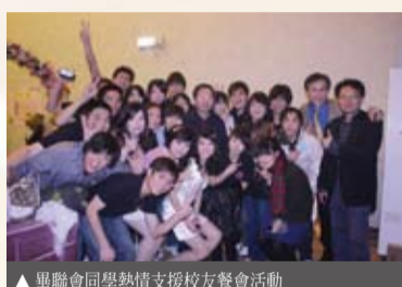
▲畢聯會同學熱情支援校友餐會活動