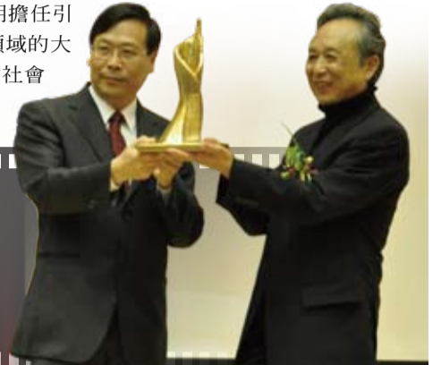
▲陳之藩獲頒第一屆元智大學桂冠文學家獎 ▲白先勇獲頒第二屆元智大學桂冠文學家獎 ▲鄭愁予獲頒第三屆元智大學桂冠文學家獎 ▲高行健獲頒第四屆元智大學桂冠文學家獎