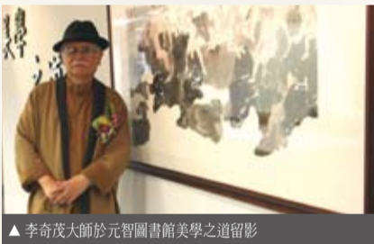
▲ 李奇茂大師於元智圖書館美學之道留影