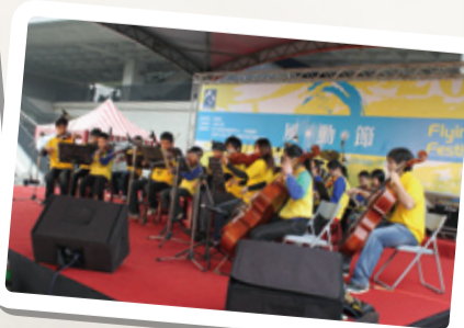
▲風動節展現各社團參與教育部社區服務之成果，元智弦樂社帶領新街國小小朋友一同表演