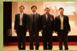
▲頒發榮譽獎項—元智學術講座