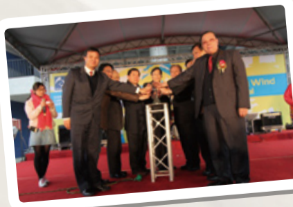
▲風動節在一片歡聲雷動的掌聲當中，由董事長、校長、元智董事會及歷任校友會會長熱鬧開幕