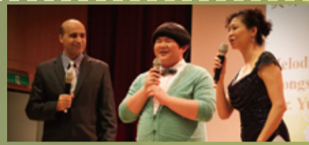
▲小胖校友祝福母校生日快樂