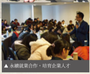
▲永續就業合作，培育企業人才