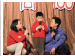
▲資訊學院校友夫妻檔闖家演出