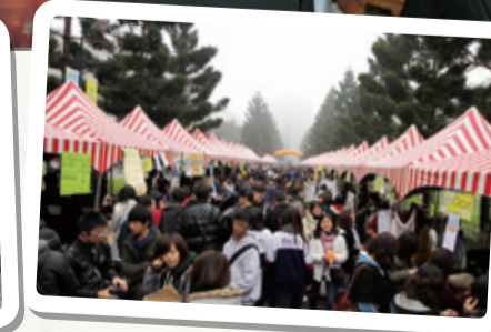
▲二手環保市集受到大家青睞，收集二收衣、推廣環保餐用具、減碳食品等