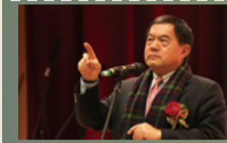
▲遠東集團董事長徐旭東鼓勵同學多了解國際情勢