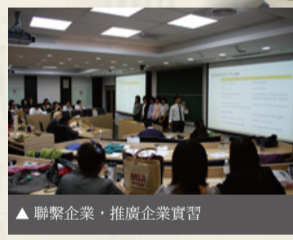
▲聯繫企業，推廣企業實習