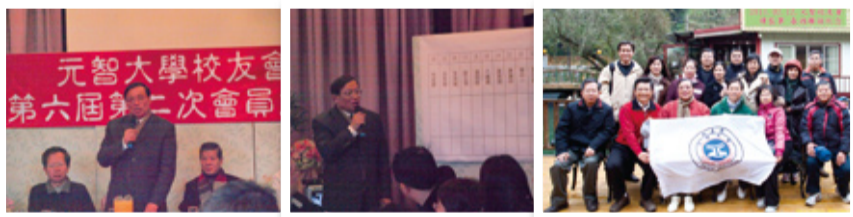
▲中華民國元智大學校友會第六、七屆理監事順利交接