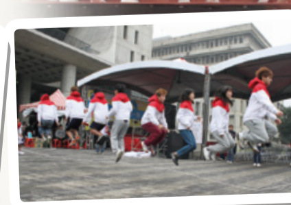
▲師生跳繩樂競賽比默契也展現創意