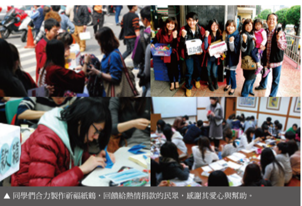
▲同學們合力製作祈福紙鶴，回饋給熱情捐款的民眾，感謝其愛心與幫助。