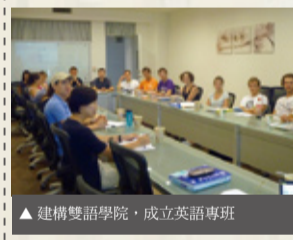
▲建構雙語學院，成立英語專班