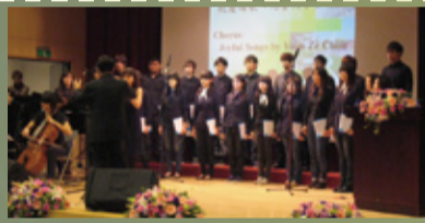
▲元智合唱團美聲獻唱