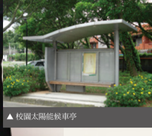
▲校園太陽能候車亭