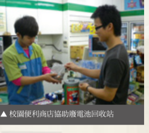
▲校園便利店協助廢電池回收站