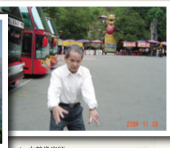
▲住在山水交會處，緊急情況下比較有存活機會