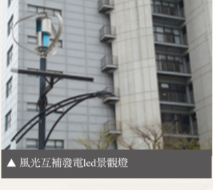
▲風光互補發電LED景觀燈