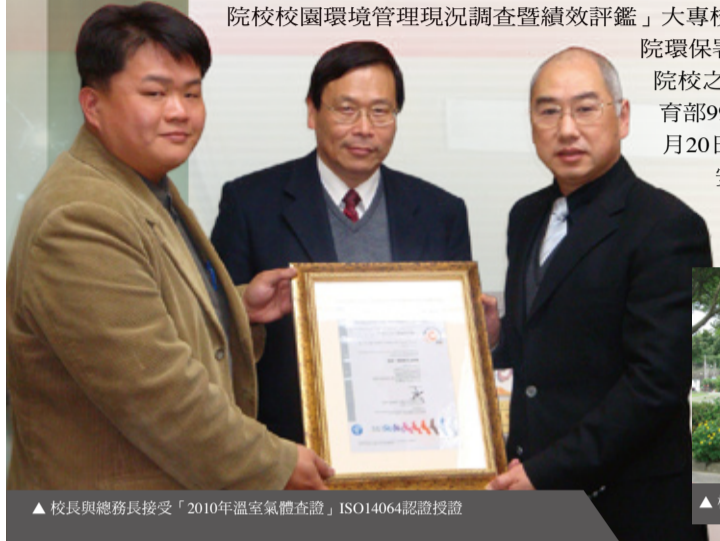
▲校長與總務長接受「2010年溫室氣體查證」ISO14064認證授證