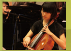
▲元智社團為校慶活動伴奏