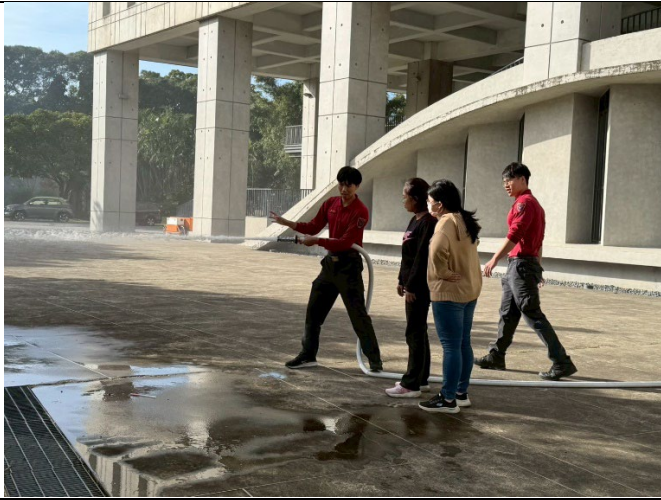
圖 5. 灑水瞄子演練