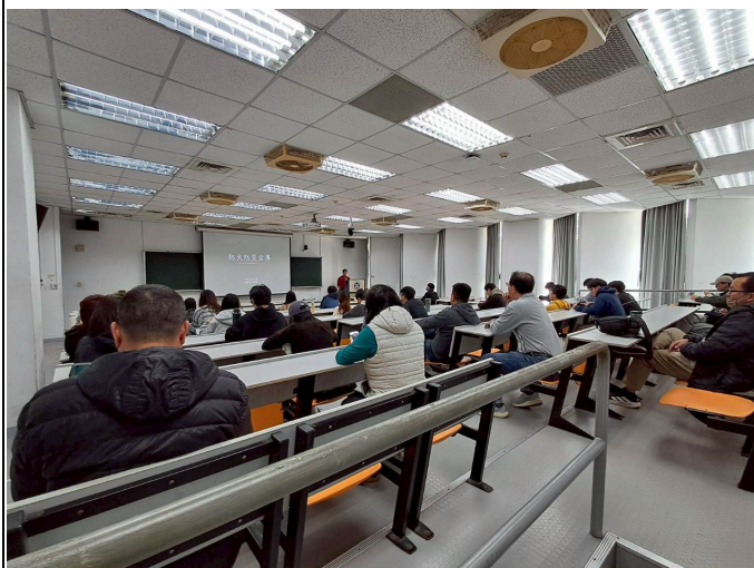
圖 2. 消防講習課程