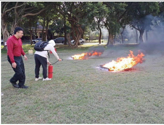
圖 3. 滅火器演練