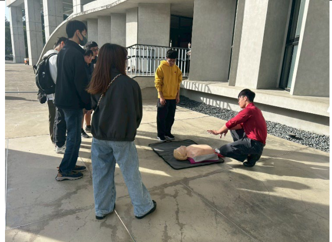
圖 4. AED+CPR 演練