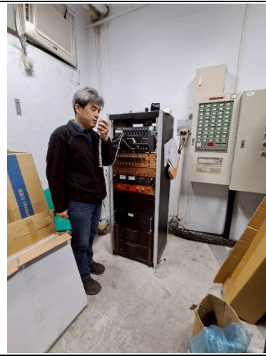
圖 6. 消防廣播