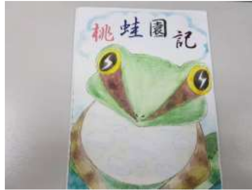
作品原稿(請勿書寫文字及頁碼)