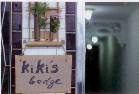
圖15 kiki's Lodge一景