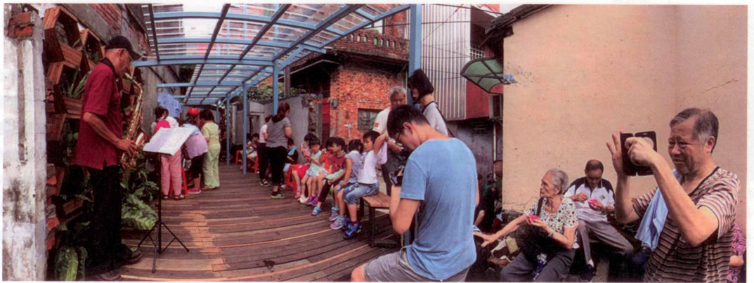
圖12 45號成果發表當天邀請社區薩克斯風樂隊演出