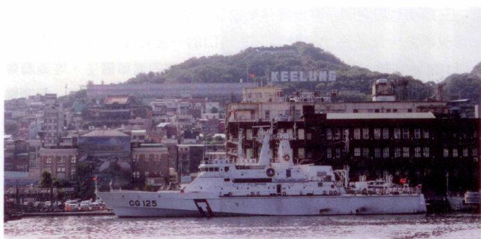
圖2 從基隆港東岸拍攝曾子寮山太平社區

面對基隆的創生，駐地工作團隊秉持著以「參與、合作」取代「指導、介入」，強調與居民一起工作，並透過「參與式設計」，在與居民互動、試做的過程中整理出適用的「模式語彙」(pattern language)，做為後續規劃設計的一種基本依據。