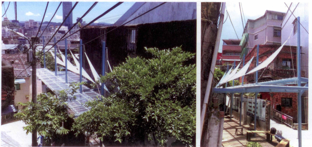
圖13、14 結合桅杆風帆造型的休憩型空間