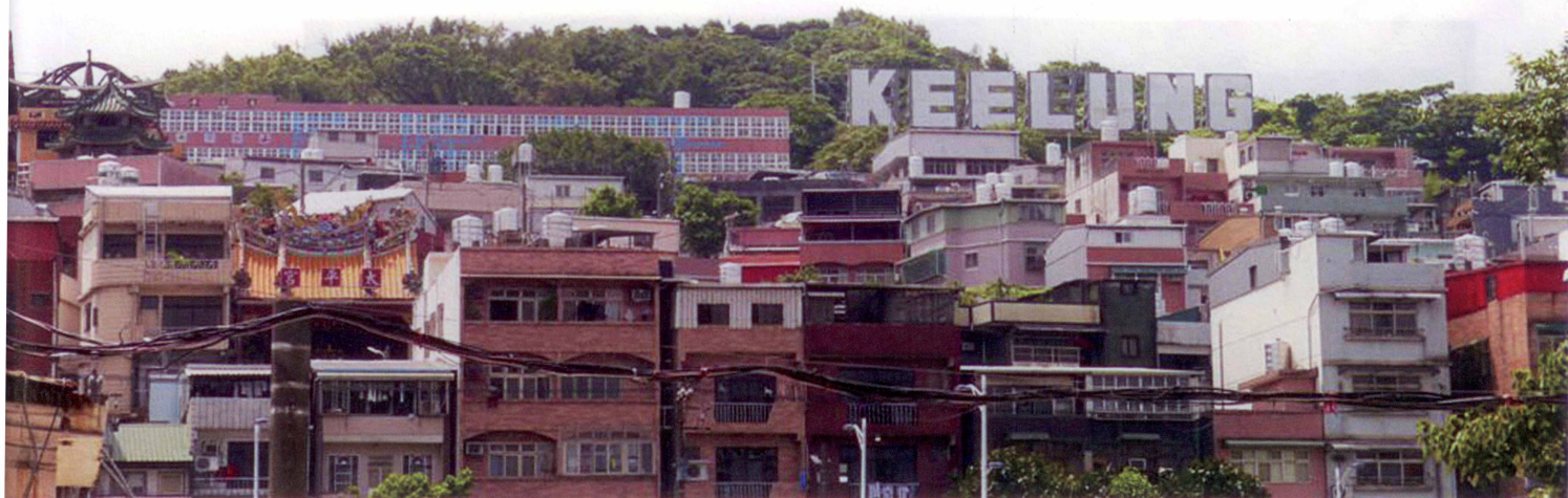
圖1 為基隆太平社區一景，建築多倚山而建，面朝港口。KEELUNG地標旁邊的一字型校舍就是已廢校的太平國小