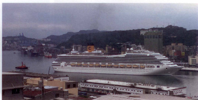
圖3 從太平國小向東岸望去的海景視野