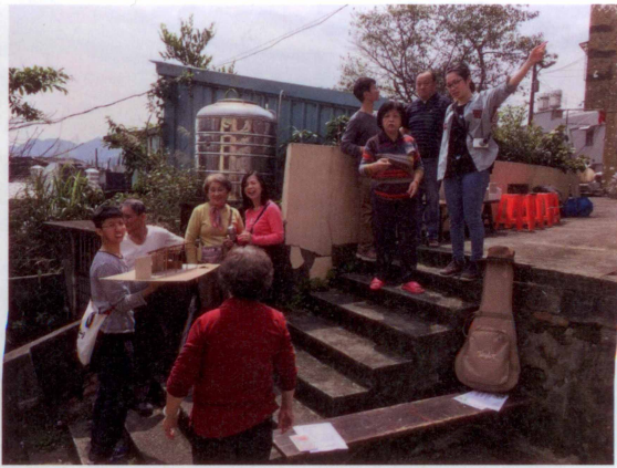
圖4、5 以「參與、合作」取代「指導、介入」