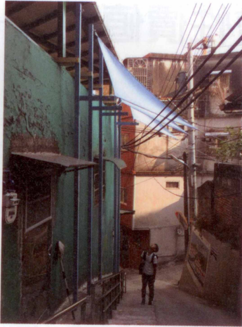
圖21、22 山海工作營期間完成了113巷兩座路邊扶手座椅系統的一比一模型