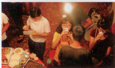
圖17、18 山海工作營曉朋組完成的彎貓食堂，在8月4日當晚開幕，邀請社區居民以一人一菜參加