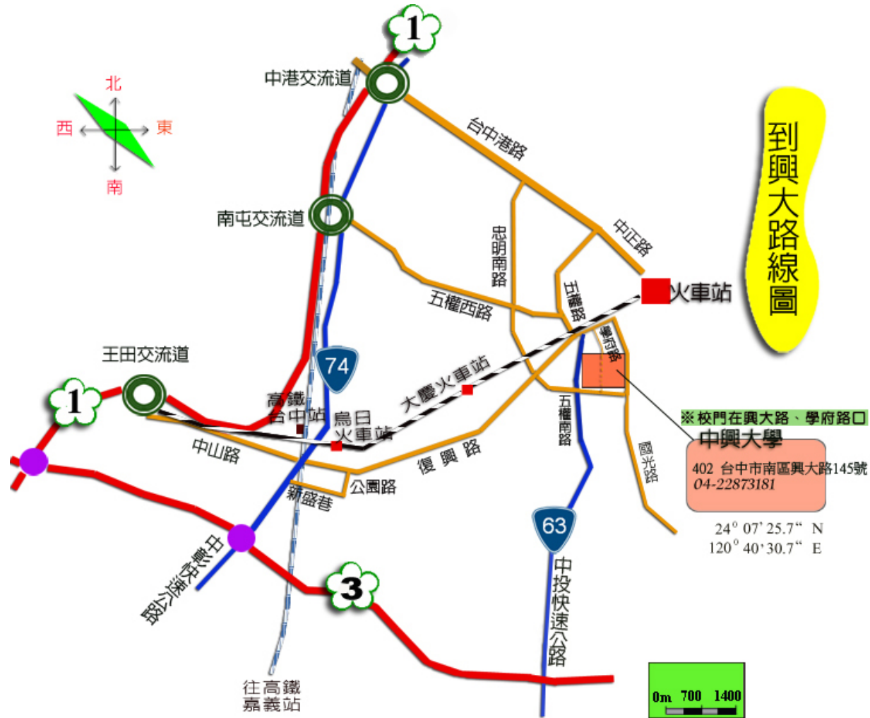
【高速公路與快速道路圖】