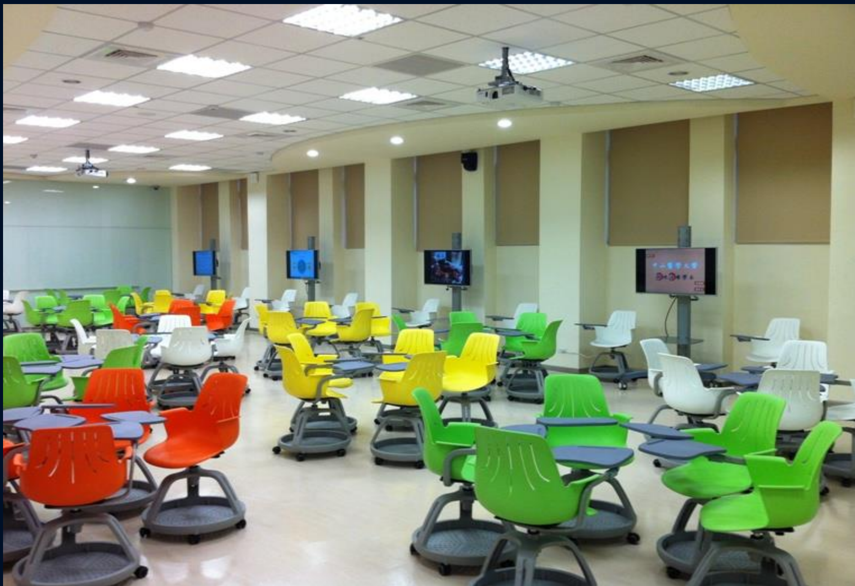
逢甲大學人言大樓積學堂教室

http://web.pr.fcu.edu.tw/~pr/fest/2013/20131208/20131208_0